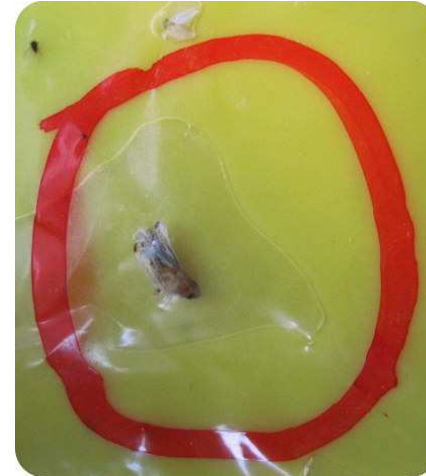
Adulto di scafoideo su trappola cromotattica